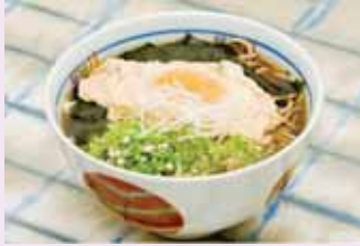
オクラとわかめの月見そば