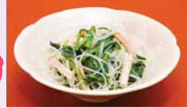
ほうれん草と春雨の中華和え

■ 材料(2人分) そば(乾燥) 150g・卵 2コ・オクラ 60g・わかめ 30g・長 ねぎ 20g 【A】だし:2と1/2カップ・しょうゆ:大さじ1と2/3・みりん: 大さじ1